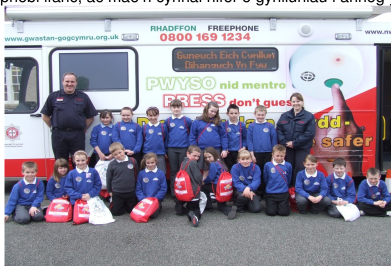
Digwyddiad Plant Diogel yn Llandudno