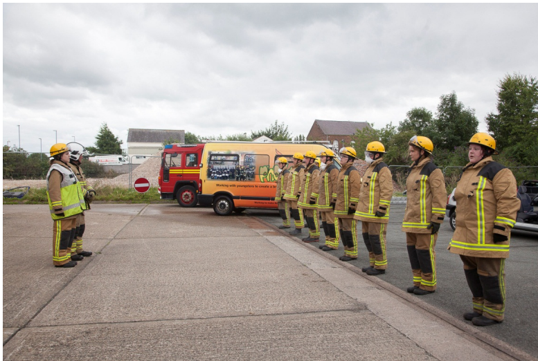
Digwyddiad i Ddathlu Cwblhau Ffenics yn yr Wyddgrug

Mae'r tîm hefyd yn cynnal digwyddiadau ymyrryd pwrpasol undydd a deuddydd am faterion penodol a allai godi mewn ardaloedd yng Ngogledd Cymru, yn ogystal â chynnal sesiynau gyda chlybiau ieuenctid a grwpiau.