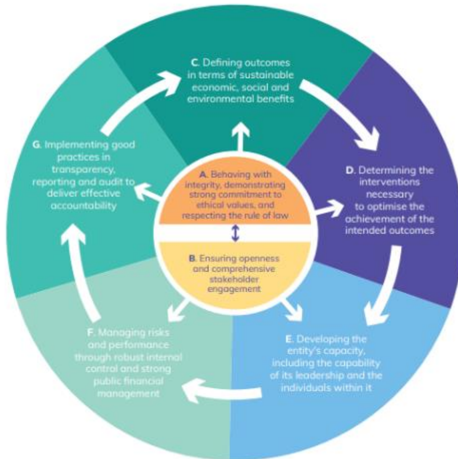
Fig. 1 Sut mae Egwyddorion llywodraethiant da yn berthnasol i'w gilydd.